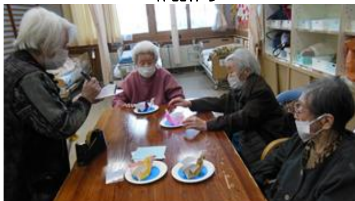
◆ 折り紙で白鳥を作りました。