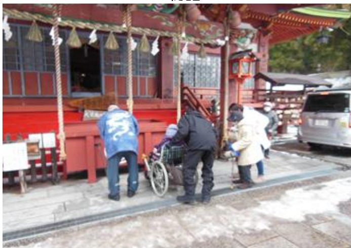
◆ 遠野郷八幡宮に参拝して来ました。 ゲーム・運動