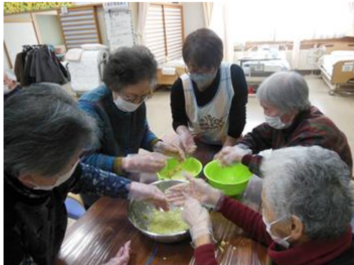
◆ 皆さん、手際よく餃子の具を包んでいました。