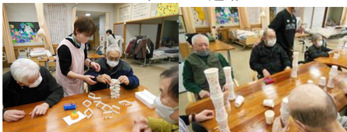
◆ 紙コップ、牛乳パックの鏡モチ積みをしました。