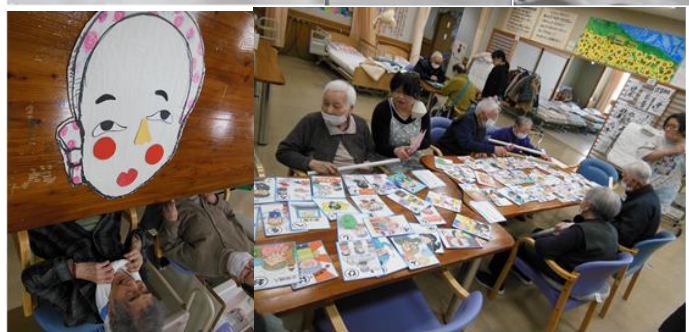
◆ 福笑い、書初め、カルタ取りをして楽しみました 初詣