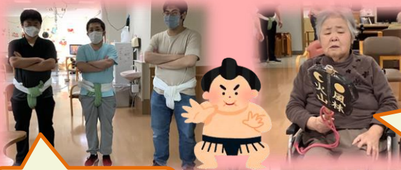
茅町代表力士の3人キマっています

11月は重端溪にドライブに出かけました。出発時は雨風が強かったですが、附馬牛に着くころには出発時の悪天候が嘘のように晴れ、ドライブ日和の気持ちのいい晴れ間が広がっていました。天気と相まって紅葉が綺麗に見え「あその山赤くなってらな。きれいだな」「こんなところもあるんだ」「いいところだなあ」「いいもの見て長生きするな」と皆さん感動されていました。