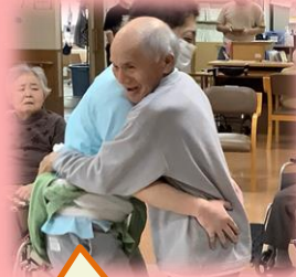
職員と組み合いをしてニコニコ楽しそうです