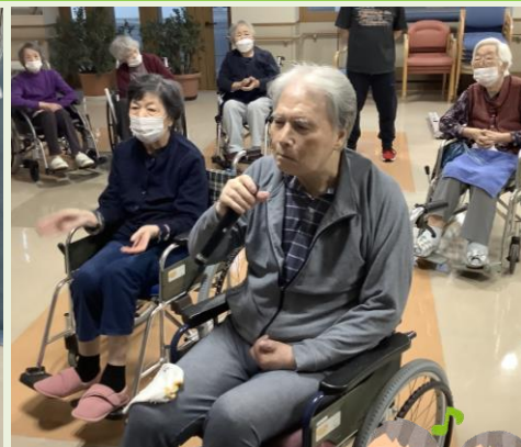
カラオケ大会の様子