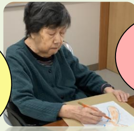
色塗りは、おてものです。