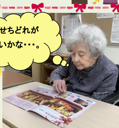
おせちどれがいいかな…。