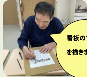
看板のAの字を描きました。

どうぞ、面会禁止が明けた頃に、若い時のご両親のお写真を1枚ご持参いただいて、思い出話を聞かせに足を運んで頂きたいと思えます。たくさん笑って、また新たな思い出を作りましょう。