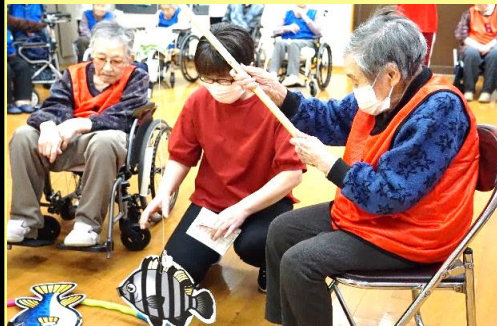
第1競技★魚釣りゲーム