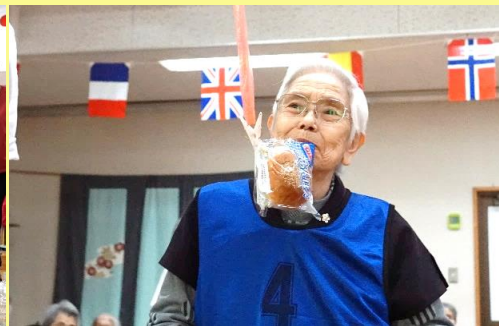
第4競技★パン食い競争