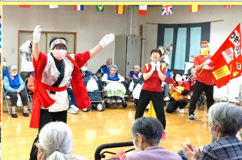
赤組応援団長登場! 熱き想い、不屈の闘志