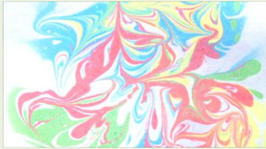
マーブリングで作った作品です

水ヨーヨーを居室に飾り、眺め ながら、昔のお祭りの話などを聞 かせてくれました。