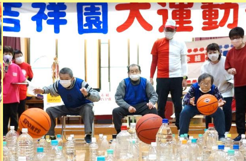
第2競技★ボウリング