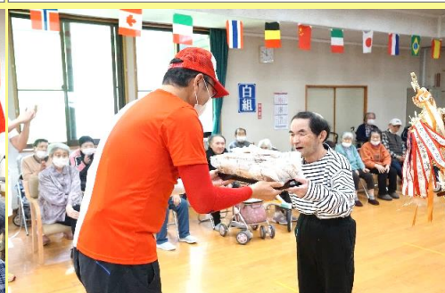
勝利のどら焼き贈呈☆