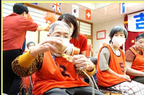
第5競技★缶巻きリレー