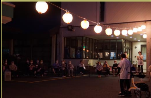
提灯が灯り感じの雰囲気♪