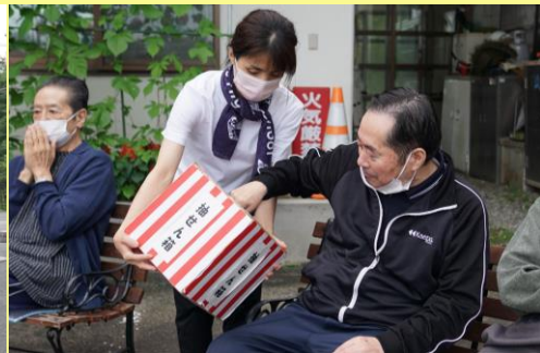
お楽しみは、抽選会！ 一等はお食事券(出前)^^