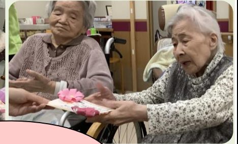
お誕生者、代表挨拶