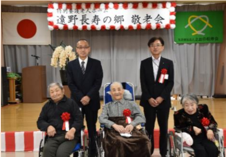
集合写真です。皆様おめでとうございます。

9月24日、遠野長寿の郷敬老会が開催されました。遠野市長より祝辞をいただき、利用者を代表し、喜寿1名、米寿3名に遠野市、施設、家族会それぞれから、お祝いの記念品がプレゼントされました。