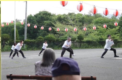
職員完全燃焼！よさこいソーラン節♪