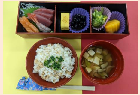
敬老のお祝い膳です。