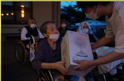
抽選会での様子。 扇風機が当たりました☆