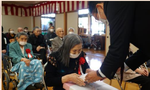
遠野市より記念品をいただきました。