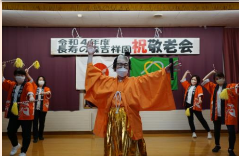
マツケンサンバⅡで盛り上がりました^^