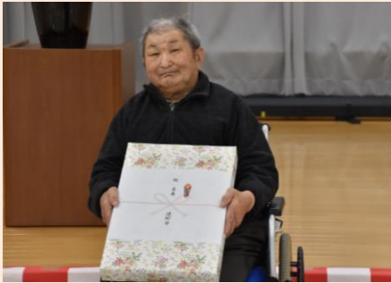
米寿おめでとうございます。