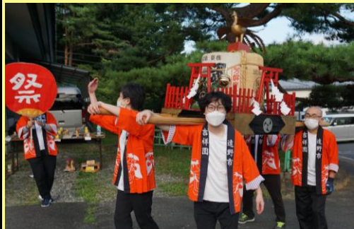
オープニングに、お神輿登場！ お菓子のお振舞もありますよ～