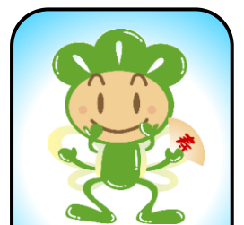
とおの松寿会キャラクター 「まっとちゃん」

〒028-0521 岩手県遠野市材木町2-22 TEL 0198-63-1328 FAX 0198-63-1338