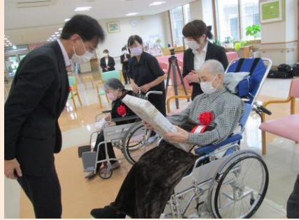
記念品が贈られました。