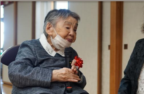
利用者さんの代表から謝辞。