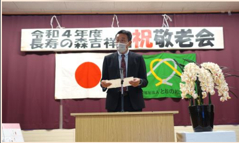
施設長よりお祝いのメッセージ。

9月30日、長寿の森吉祥園敬老会が行われました。今年度は敬老者の中から米寿6名、卒寿4名、最高齢102歳の方に記念品が贈られました。