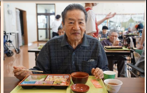
昼食は厨房特製、敬老お祝い膳♪