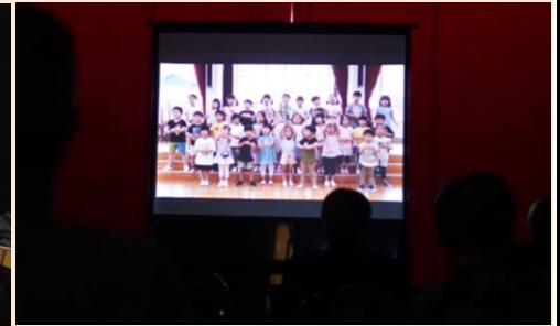
遠野聖光こども園さんからビデオメッセージをいただきました。