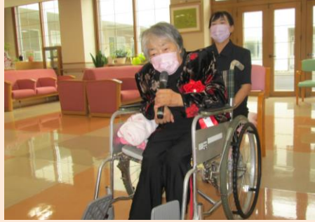
敬老者代表の謝辞です。