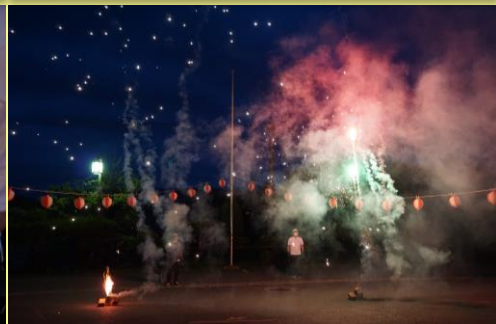
フィナーレは打ち上げ花火で 大団円^^