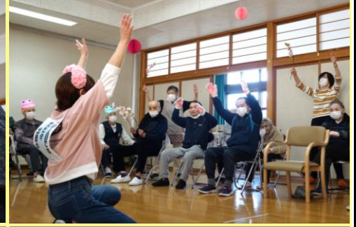
曲に合わせて踊りましょう♪