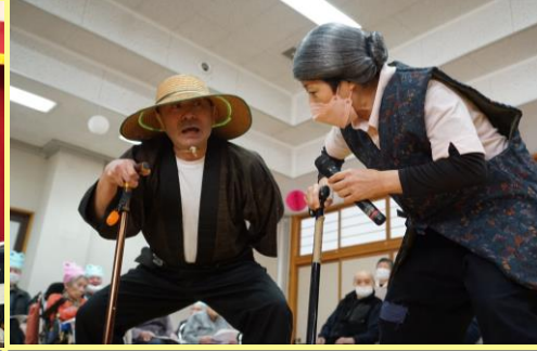
笑いあり涙ありの 職員扮する熟年夫婦