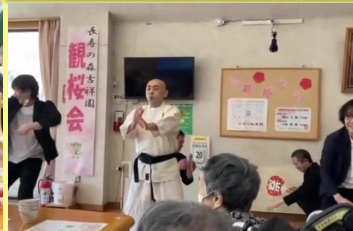
一世風靡セピアで ソイヤ、ソイヤ! 空手演舞♪