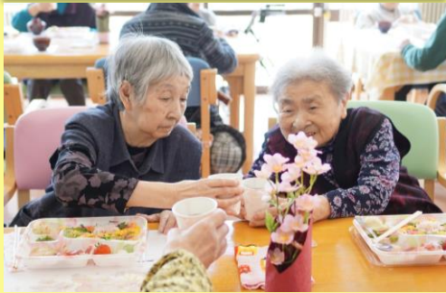
中庭の桜を愛でながら、 お花見弁当いただきます^^