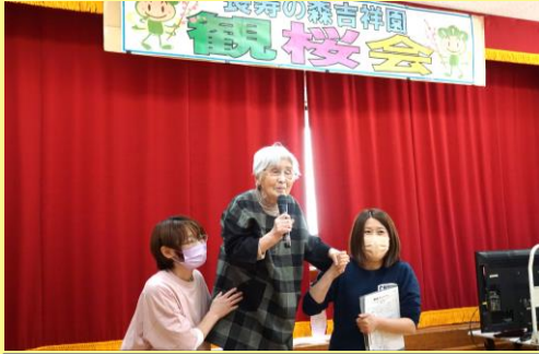
元気よく開会宣言をいただきました。