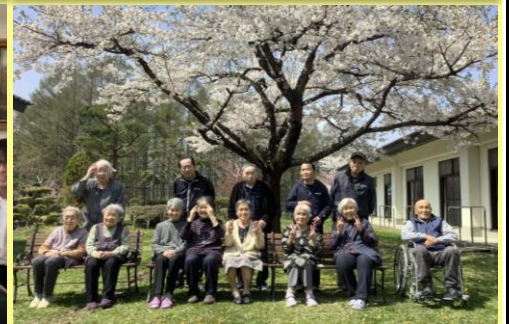
満開の桜と記念撮影📷☆